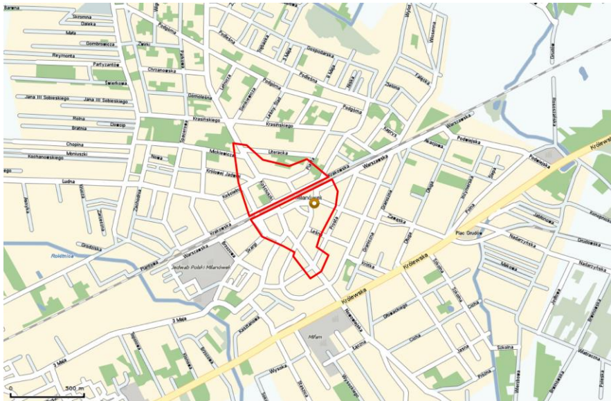
Ryc. 2. Lokalizacja obszaru objętego projektem planu na tle miasta

W granicach obszaru opracowania największą uciążliwość dla środowiska stanowią zabudowania wielorodzinne i usługowe oraz sieć komunikacyjna, włącznie z niekontrolowanymi parkingami samochodów osobowych.