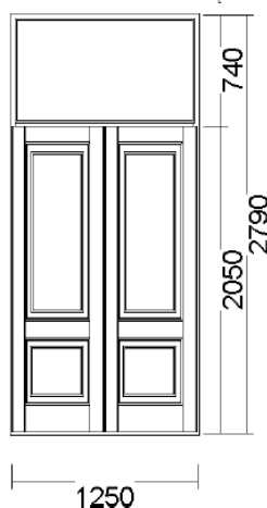
Widok stolarki od zewnątrz

VI. Zamawiający zastrzega iż podane wymiary są wymiarami orientacyjnymi, a Wykonawca przed przystąpieniem do realizacji usługi zobowiązany jest do dokonania szczegółowych pomiarów drzwi. Niedokonanie pomiarów we własnym zakresie nie zwalnia Wykonawcy z obowiązku prawidłowego obsadzenia i zamontowania drzwi.