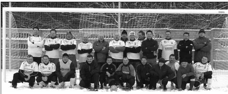
Zawodnicy KS „Milan”

Zajęcia obejmują gry i zabawy z piłką, oraz ćwiczenia ogólnorozwojowe. Chłopcy zaczęli treningi od letniego obozu przygotowawczego. Obecnie drużyna gra w rozgrywkach MZPN w grupie „ORLIKI”, zajmując V miejsce.